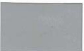
7048 Elegant Grey