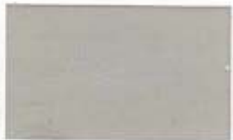
7045 Light Grey