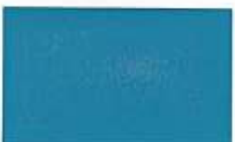
2018 Stylish Blue