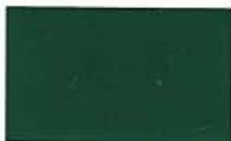
1015 Classic Green *