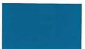
2020 Sparking Blue *