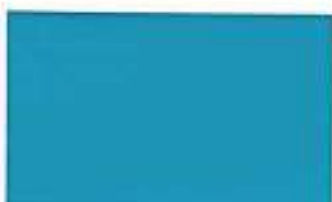
2019 Oriental Blue