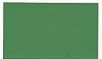
1012 Glowing Green