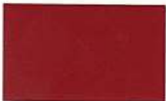
6020 Roasted Brown