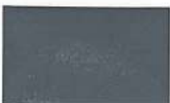
8015 Retro Grey