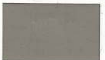
7046 Creative Grey