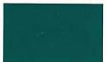
1016 Refined Green