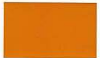
3025 Radiant Yellow