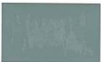
1014 Grey Green