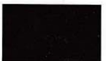
8016 Black *