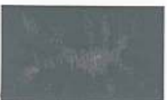
8014 Dark Grey